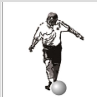
#Teknik Menggiring Bola